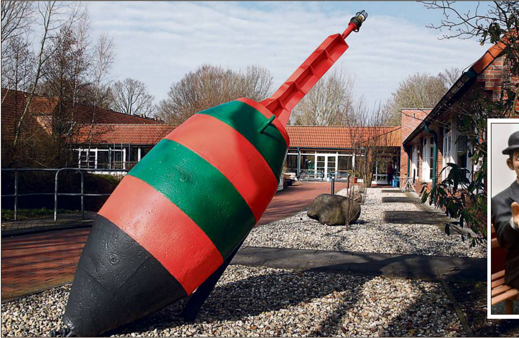
Hier geht's entlang: Die Boje weist den Weg ins Evangelische Senioren- zentrum, seit 25 Jahren ein zentraler Hafen in der Altenpflege. – Foto unten: Zwei alte Bekannte grüßen – Dick und Doof.