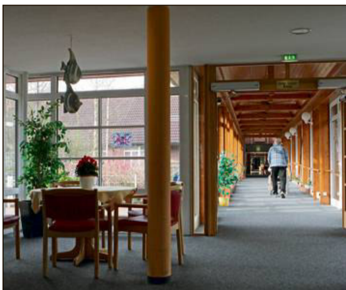
Viele verschiedene Ausblicke nach draußen: der Verbindungsweg zwischen den beiden Wohnbereichen.

Seit der Errichtung des Seniorenzentrums wurde immer wieder in das Gebäude und das Grundstück investiert.